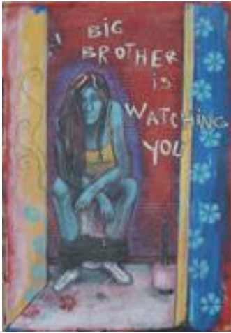
Doc. 2 : Barbara d'Antuono, Big Brother is Watching you , acrylique sur papier, 100 x 70 cm, 2010