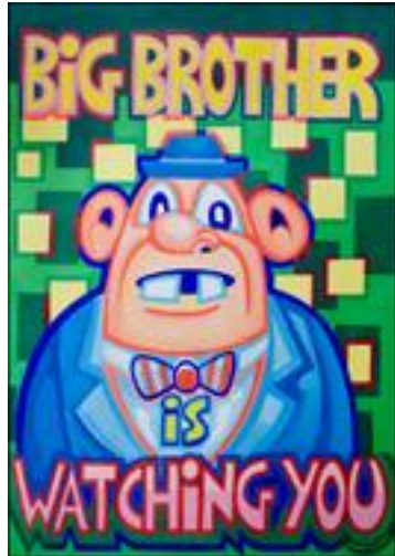
Doc. 5 : Captain Cavern, Big Brother is Watching you , acrylique sur papier, 100 x 70 cm, 2010