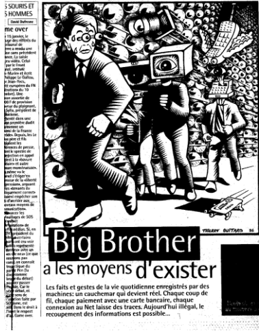
Doc. 3 : Illustration de Thierry Guitard publiée Dans Libération , Janvier 1996

Image très politisée, à l'instar de l'affiche de Thierry Guitard reprise d'une couverture qu'il réalisa pour le journal Libération , en 1996 (cf. doc. 3 et couverture du dossier de presse) et qui déjà dénonçait les dérives liées aux nouvelles technologies. Image ironique comme celle de Barbara d'Antuono qui, en nous montrant l'intimité la plus absolue d'une femme, démontre le côté absurde qu'il y aurait à tout filmer. (cf. doc. 2).