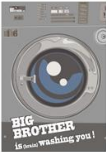
Doc. 4 : Clem, Big Brother is Washing you , Infographie, 100 x 70 cm, 2010

Image très politisée, à l'instar de l'affiche de Thierry Guitard reprise d'une couverture qu'il réalisa pour le journal Libération , en 1996 (cf. doc. 3 et couverture du dossier de presse) et qui déjà dénonçait les dérives liées aux nouvelles technologies. Image ironique comme celle de Barbara d'Antuono qui, en nous montrant l'intimité la plus absolue d'une femme, démontre le côté absurde qu'il y aurait à tout filmer. (cf. doc. 2).