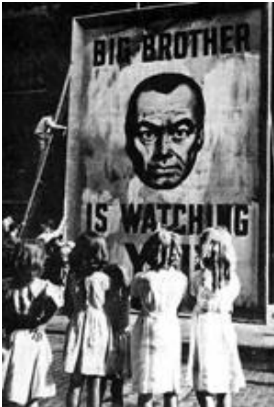
doc.1 : Image extraite du film 1984 de Michael Anderson (1956)