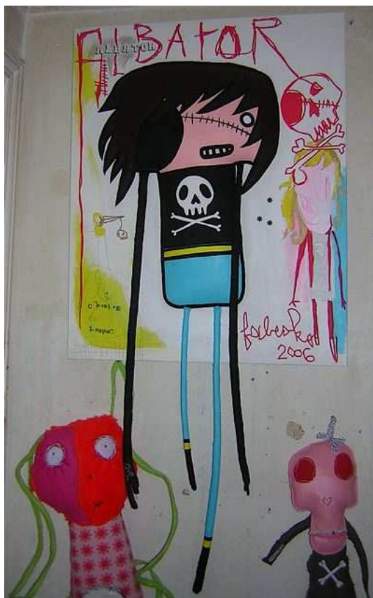
Albator Fabesko 2006 Acrylique sur toile 100 x 50 cm