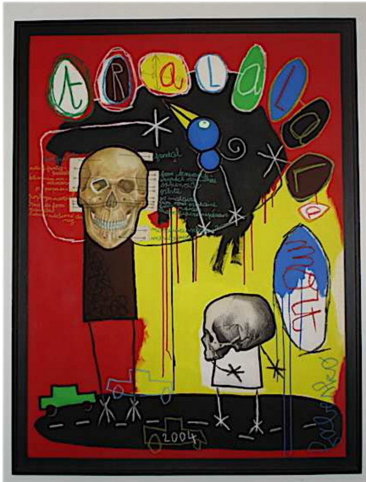
Tralala la mort Fabesko 2004 Acrylique et pastels sur toile 130 x 97 cm