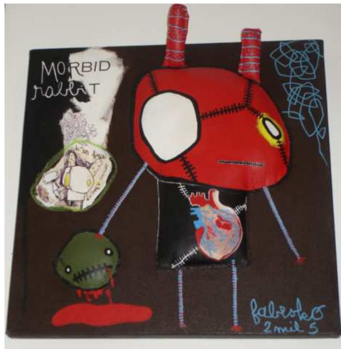
Morbid Rabbit Fabesko 2005 Acrylique sur toile 60 x 60 cm