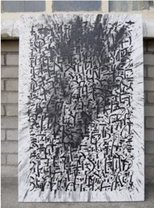
Sowat : J.raf , encre de Chine sur toile, 2009, 90 x 60cm

PUBLICATION, textes dans le livre de Bom K HB Blacktrace , EDITIONS Populaires, Toulouse.