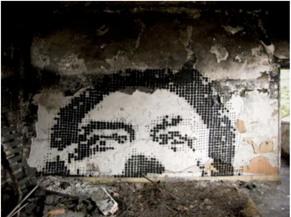
Kan : Dali , Fresque réalisée à Paris en 2010, aérosol sur mur, 1,80 x 4 m,