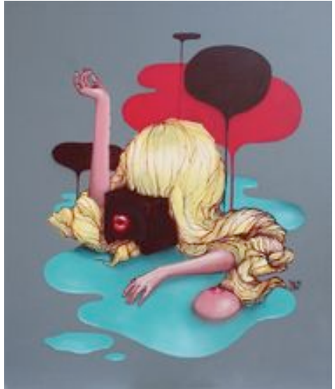
Blo : Sans titre , aérosol sur toile, 120 x 140 cm, 2009.