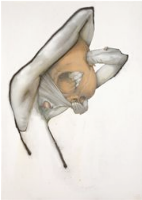
Bom.k : Sans titre , Aérosol sur toile, 98 x 130 cm, 2009