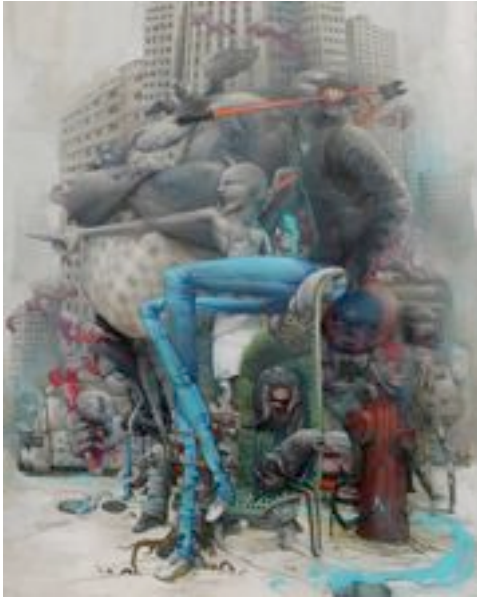
Bom.k : La limite , aérosol sur toile, 130 x 200 cm, 2009